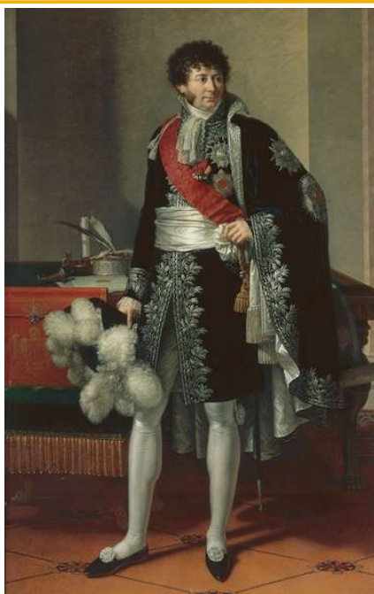
François-Xavier FABRE Portrait de Henri-Jacques-Guillaume Clarke, Comte d'Hunnebourg et Duc de Feltré, Maréchal de l'Empire et Ministre de la Guerre 1810 Huile sur toile, 217 x 144 cm