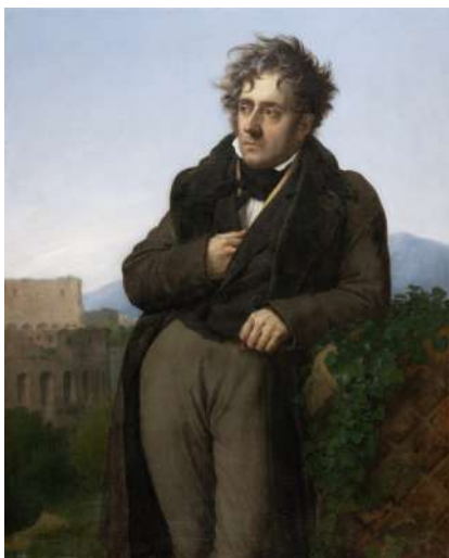
Anne Louis Girodet Roussy de Trison Portrait de Chateaubriand 1808 Huile sur toile, 120 x 96 cm