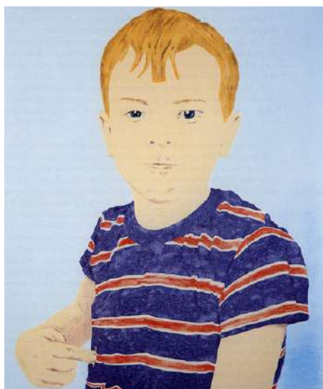
James Rielly Curious 1997 Huile sur toile de coton, 182 x 152 cm