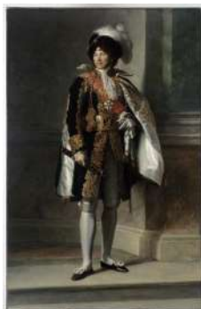
François Gérard (1770 – 1837) Portrait de Joachim Murat (1764 – 1815) en grande tenue de maréchal de l'Empire 1805, Musée de l'Armée

Les effigies officielles, ou portraits d'apparat, sont régies par des règles communes de composition et de positionnement du modèle. Ces « modèles » ou « types » ne laissent pas une grande part de liberté à l'artiste mais permettent de comprendre immédiatement de qui il s'agit. Ces tableaux étaient destinés à des lieux réservés à l'exercice du pouvoir, des palais de l'Empire ou des ambassades, dans le monde entier. L'artiste réalisait parfois plusieurs versions ou copies pour différents lieux. Les maréchaux de France posent le plus souvent debout, en pied, arborant leur somptueux costume de cérémonie, soit devant une colonne, symbole de puissance, soit devant un paysage en lien avec un événement ou une situation géographique, soit dans un intérieur relativement sobre.