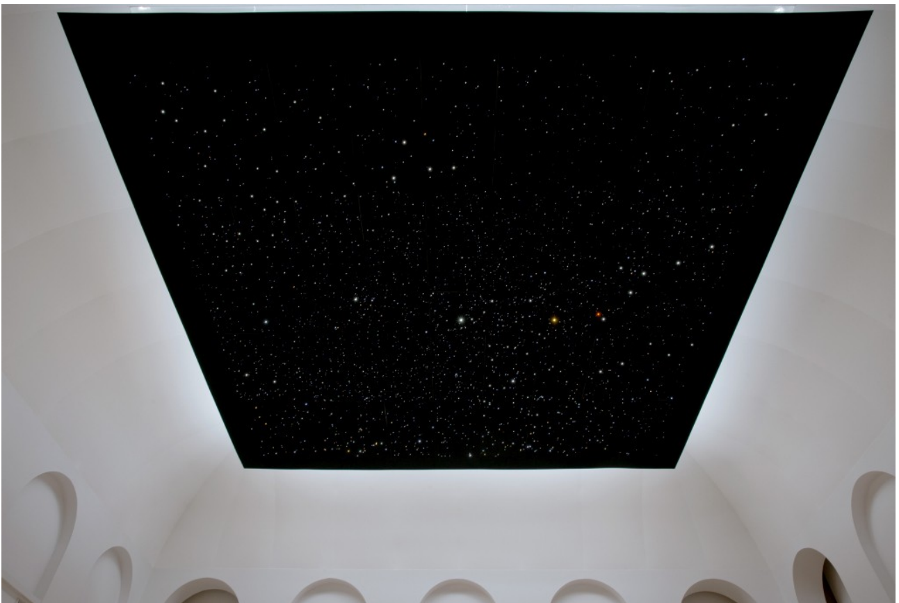
Angela Bulloch, Firmamental Square , 2022

À la manière d'Angela Bulloch, créez votre observatoire à étoiles !