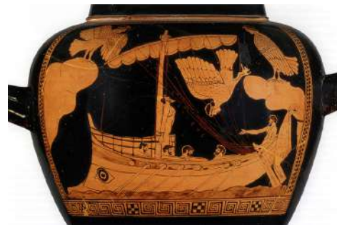
Vase à figures rouges, 5 e siècle av. J.-C., British Museum, Londres

Thelxepia (celle qui méduse par le chant épique) et elles étaient considérées comme des musiciennes extraordinaires : l'une jouait de la lyre, une autre chantait, la troisième avait la flûte pour instrument. La représentation de la sirène mi-femme mi-poisson est plus tardive : elle est issue du folklore médiéval nord-européen. C'est celle qui s'est imposée au fil des siècles, au détriment de la figure ailée antique d'Homère.