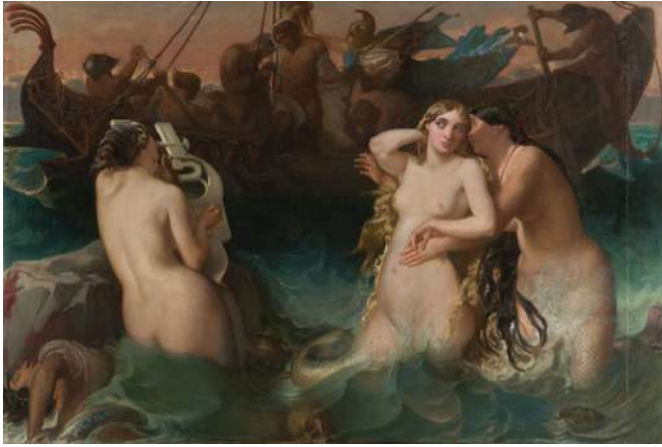
Victor-Louis Mottez Ulysse et les sirènes

Avant 1848, œuvre présentée au Salon de 1848 huile sur toile, 124,5 x 182,5 x 2 cm