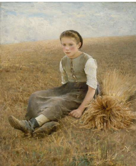
Hugo-Frédéric SALMSON La Petite Glaneuse