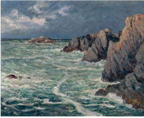
Maxime MAUFRA Côte de Domois (Belle Ile-en-Mer)

Vers 1911 Huile sur toile 65 x 81 x 2,5 cm