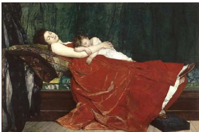
Alphonse Eugène Félix LECADRE Le Sommeil

Devant les œuvres, avant même de parler des tableaux, demandez aux élèves de votre groupe de nommer toutes les couleurs qu'ils connaissent. N'hésitez pas à utiliser les couleurs qu'ils portent sur eux : le pull, le pantalon, les chaussures... pour les aider