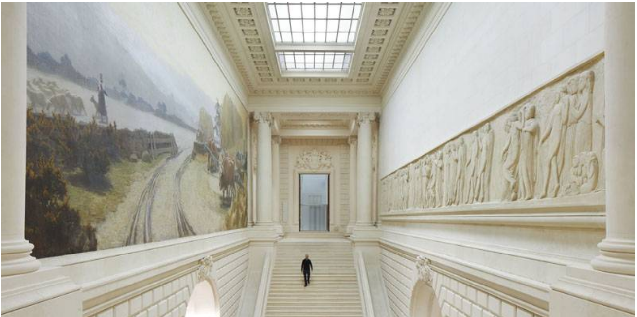
Ar skalier veur

Ouzhpenn ar choaz-se ez eus bet graet traoù da greñvaat inertiezh termek naturel ar savadur, hag e-se da lakaat anezhañ da veveziñ nebeutoc’h a energiezh, war an ampl d’ar pezh a c’houlenner er reolennoù Kalite Uhel a-fet Endro.