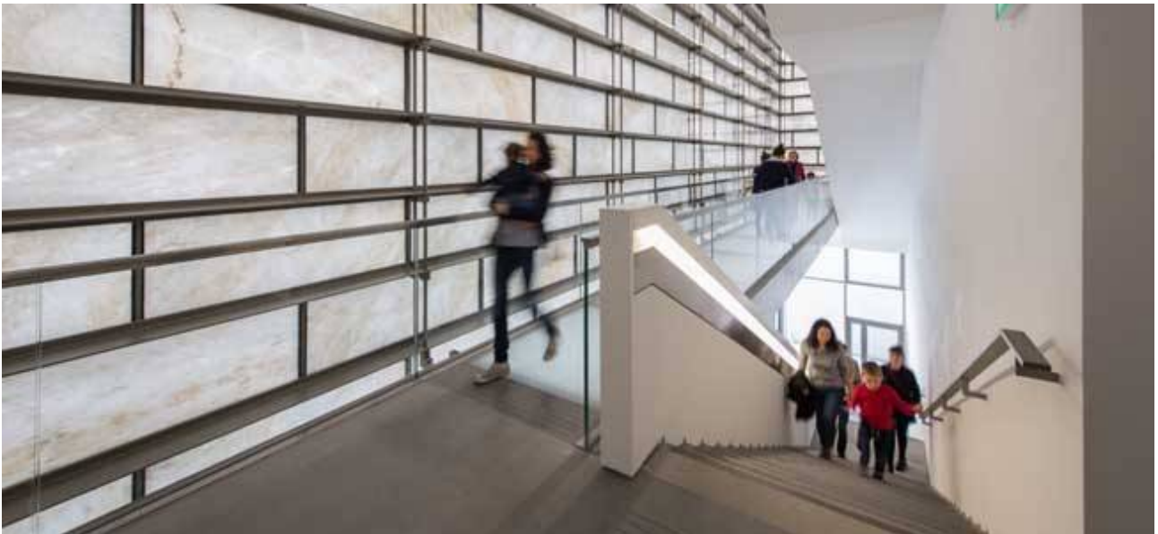
An Diñs