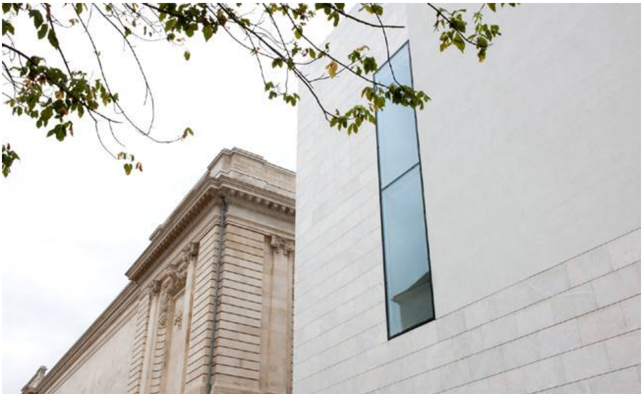
Ar mirdi, gwelet eus an diavaez, a gej an arkitektouriezh kozh hag an hini a vremañ

Sturiet e oa bet ar raktres astenn ha reneveziñ gant ar c'habined arkitektourien eus Breizh-Veur Stanton Williams. Lakaet ez eus war wel tri batis hag a ziskouez, dre an doare m'int bet savet, amzer pep hini anezho : ar Palez, Chapel an Orator hag an Diñs nevez-flamm-flimin.