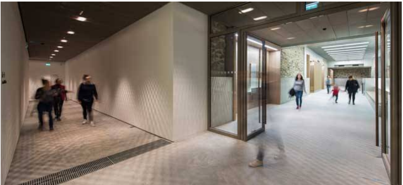
Dan ar mirdi

Pa oa bet adkempennet al lec'hioù gant Stanton Williams e oa fellet d'ar c'habined krouiñ ur bale kempoell er mirdi hag en arkitektouriezh, e servij an arz. Ar veaj a-dreuz dastumadoù puilh ar mirdi a bed ac'hanoc'h da vont e-kreiz lec'hioù eus ar c'hentañ a-fet arkitektouriezh ha da gerzhet a-hed istor an arz, eus an 13 vet d'an 21 vet kantved.