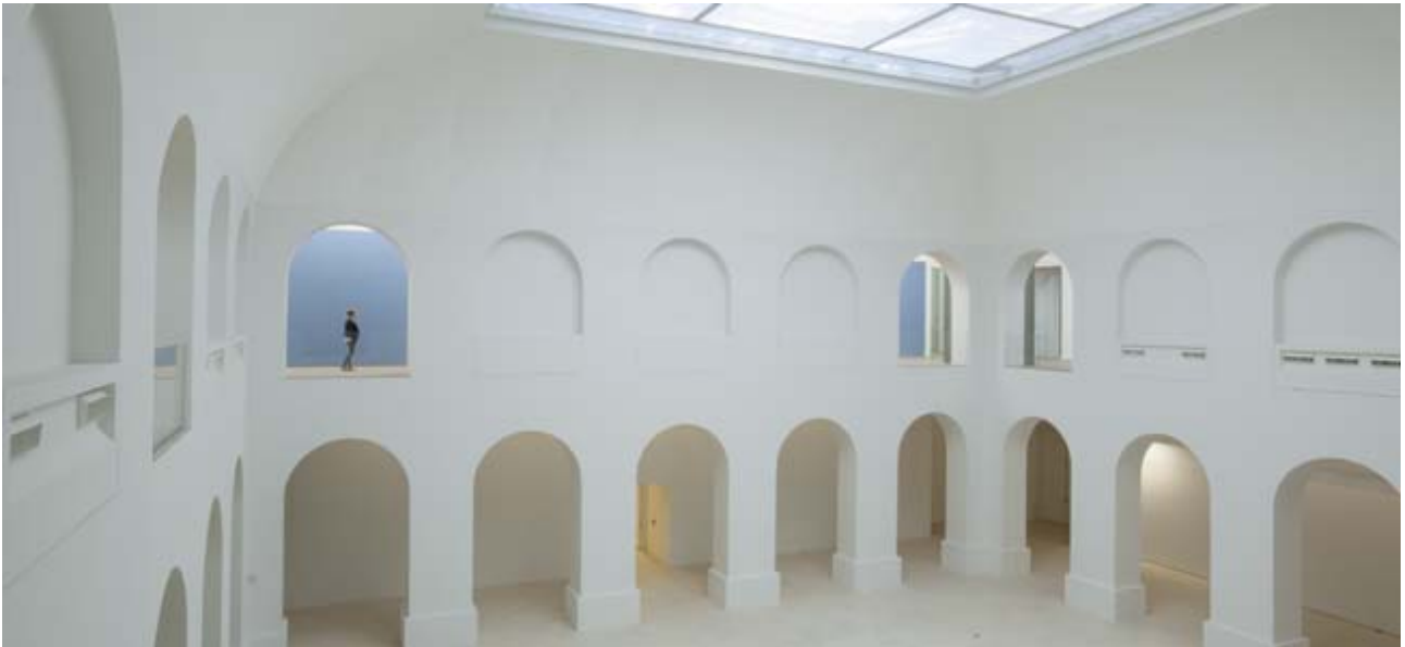
Ar Patio