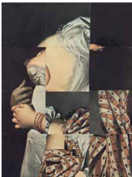
Ghérasim Luca, Cubomanie (Portrait de Melle Rivière d'après Ingres) , sans date, collage, 25 x 18,2 cm, Fonds de dotation Jean-Jacques Lebel

Certaines œuvres du Fonds sont exposées dans le parcours des collections où elles sont signalées par une pastille Fonds de dotation Jean-Jacques Lebel .