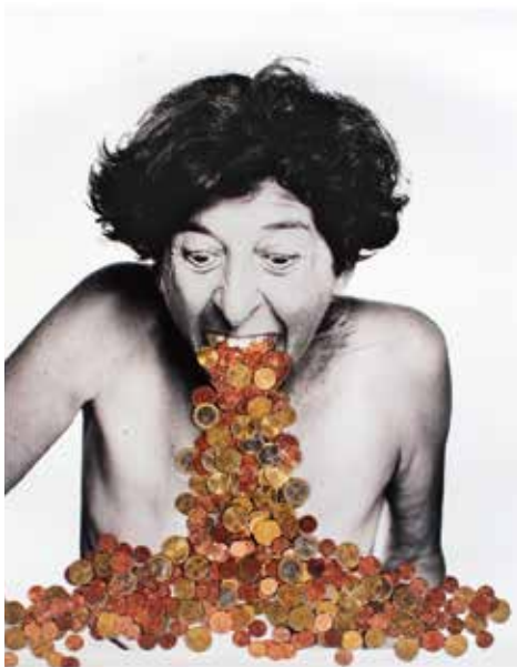
Esther Ferrer, Europortrait , 2002, Photomontage, 78,5×63,5cm, Fonds de dotation Jean-Jacques Lebel © ADAGP, Paris, 2020

Mouvement artistique datant des années 1960 amenant l'idée d'un rapprochement entre l'art et la vie. Influencé par Dada et le happening, Fluxus touche aussi bien les arts visuels que la musique et la littérature. Par l'humour et la dérision, il interroge la place de l'art dans la société, le rôle de l'artiste ou encore le statut de l'œuvre d'art.