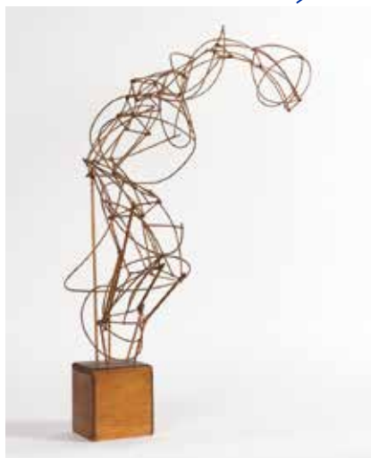
Isabelle Waldberg, Grand Piccucule , 1943, bois de hêtre, 116 x 56 x 26 cm, Fonds de dotation Jean-Jacques Lebel © ADAGP, Paris, 2020 © Musée d'arts de Nantes – Photo C. Clos