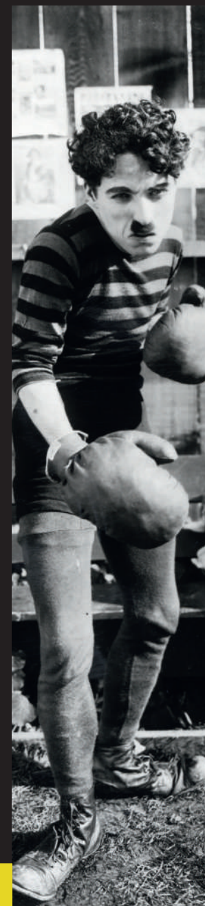
Charlie Chaplin, Charlot boxeur , 1915

Où ? Dans l'auditorium du Musée d'arts de Nantes, au niveau -1.