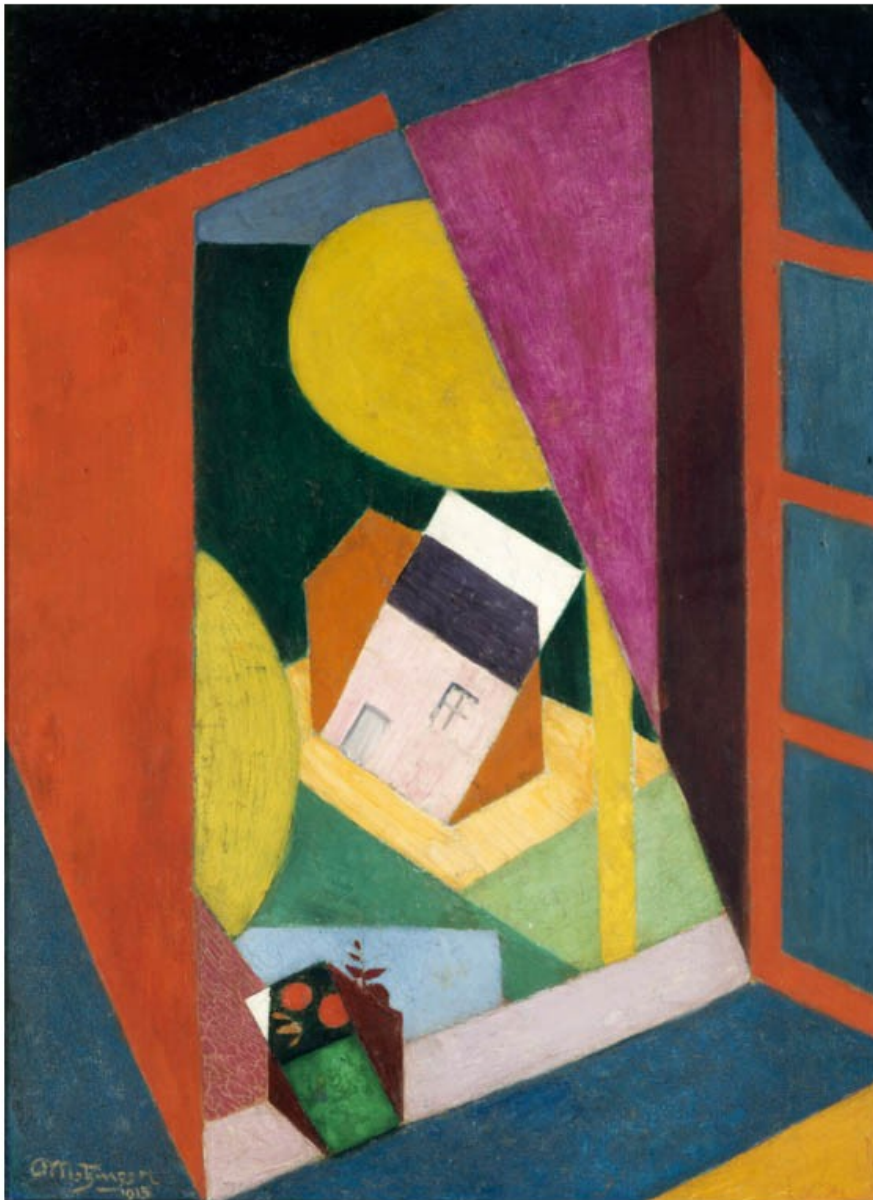
Jean Metzinger, Paysage à la fenêtre ouverte , 1915

À la manière de Jean Metzinger, créez la vue de votre fenêtre !