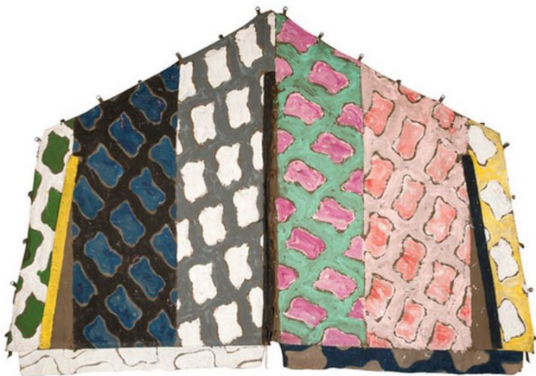
Sans Titre, 1979

À la manière de Viallat, créez votre propre forme et jouez avec les couleurs et les supports !